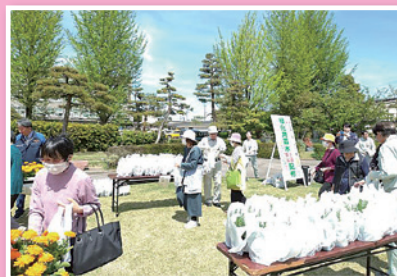
地域緑化活動の支援