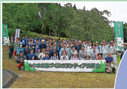
森づくりボランティア活動の推進