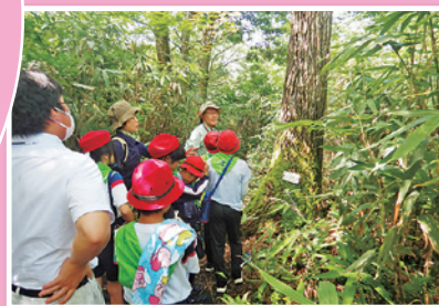
花とみどりの少年団の育成