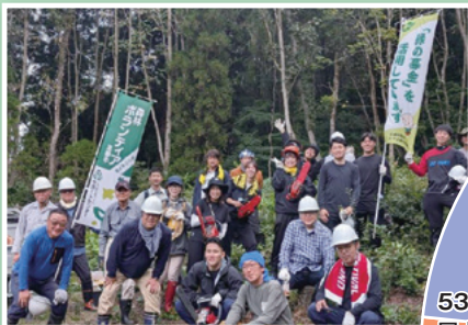
森づくりボランティア活動の推進