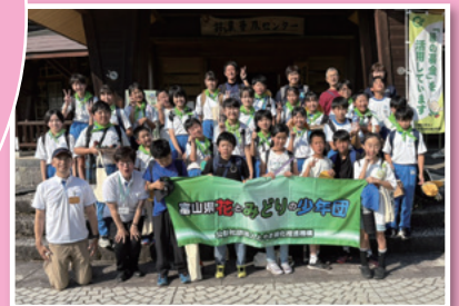
花とみどりの少年団の育成