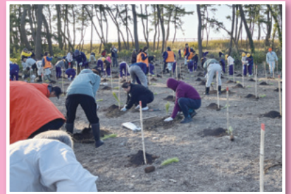
地域緑化活動の支援